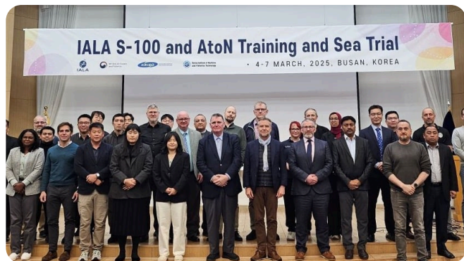
IALA S-100 kurs i Korea.

Leveransen understreker behovet for at ECC opererer på nye fagområder i takt med at teknologien tas i bruk i hele den maritime verdikjeden. Det tette samarbeidet med IALA fortsetter, og bidrar til å styrke ECCs posisjon som en global teknologirådgiver innen moderne e-navigasjon.