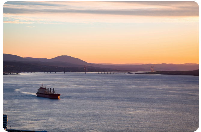
St. Lawrence River, Canada.

Testområdetets offisielle S-100-data ble gjennom prosjektet gjort operative, og er nå for første gang tilgjengelig for ordinært salg gjennom PRIMARs produktkatalog. Prosjektet vakte også stor oppmerksomhet langt utenfor den tradisjonelle maritime sektoren; på LinkedIn ble det registrert over 160 000 visninger i løpet av testperioden.